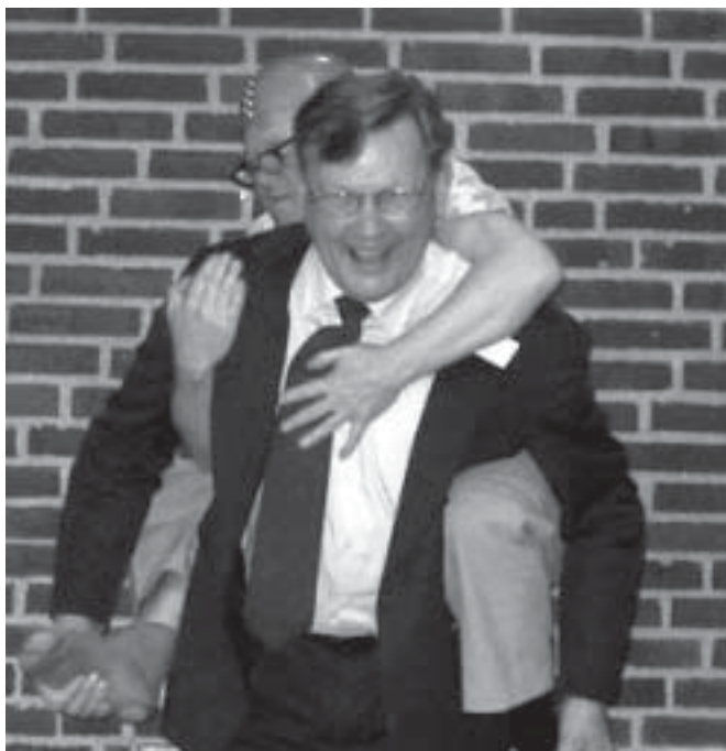
"Årets par" på slap line under Årsmødet 2004