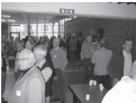
For en gangs skyld var Mark- og Vejfredsloven også et samtaleemne i kaffepauserne.

I sommeren 2003 blev der nedsat et udvalg, som fik til opgave at gennemgå loven og vurdere, om nogle bestemmelser ikke længere var aktuelle på grund af den generelle samfundsudvikling og derfor kunne ophæves. Udvalget skulle herefter vurdere, om de resterende aktuelle bestemmelser kunne overføres til anden lovgivning, så mark- og vejfredsloven helt kunne ophæves. Af kommissoriet fremgik det, at udvalget skulle afgive en rapport til Fødevareministeren, hvilket vil ske omkring den 1. april 2004.