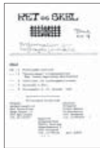
Forsiden af blad nr. 1

Hegnsynsforeningens blad er nu udkommet 100 gange. Det første udkom i 1974, kort efter foreningens stiftelse.