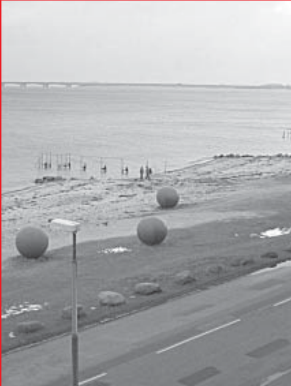
Nyborg Strand Årsmødet 2005