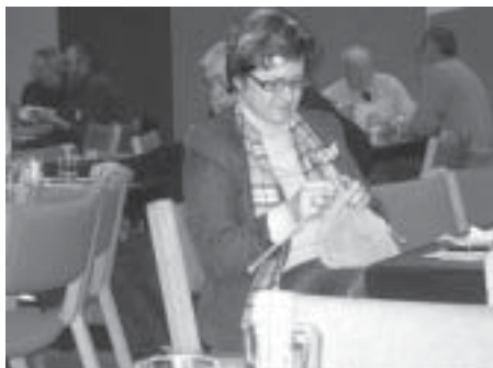
En ret og to vrang

Retten lagde ved afgørelsen til grund, at B i 1998 og senere opsatte flere fag flethegn, der stod på egen grund 10-30 cm fra skel, og at A ikke havde protesteret mod dette før i 2002, hvor B satte de sidste fag op. Henset til hegnets højde og placering tæt på skel og til, at det i en længere periode